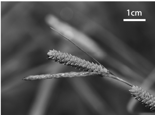
図5. タチスゲの雌小穂と雄小穂