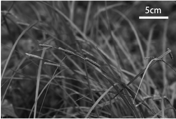
図4. 自生地のタチスゲ