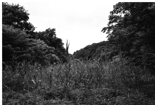
図2. 生育地の谷戸の景観

調査地は、東京都立野山北・六道山公園内の谷戸に位置し(図1)、すでに稲作が行われていないヨシやガマが繁茂する湿地である(図2)。また、当地は東京都レッドリスト 2020 (東京都環境局, 2021) で絶滅危惧IA類にランクされているオオ